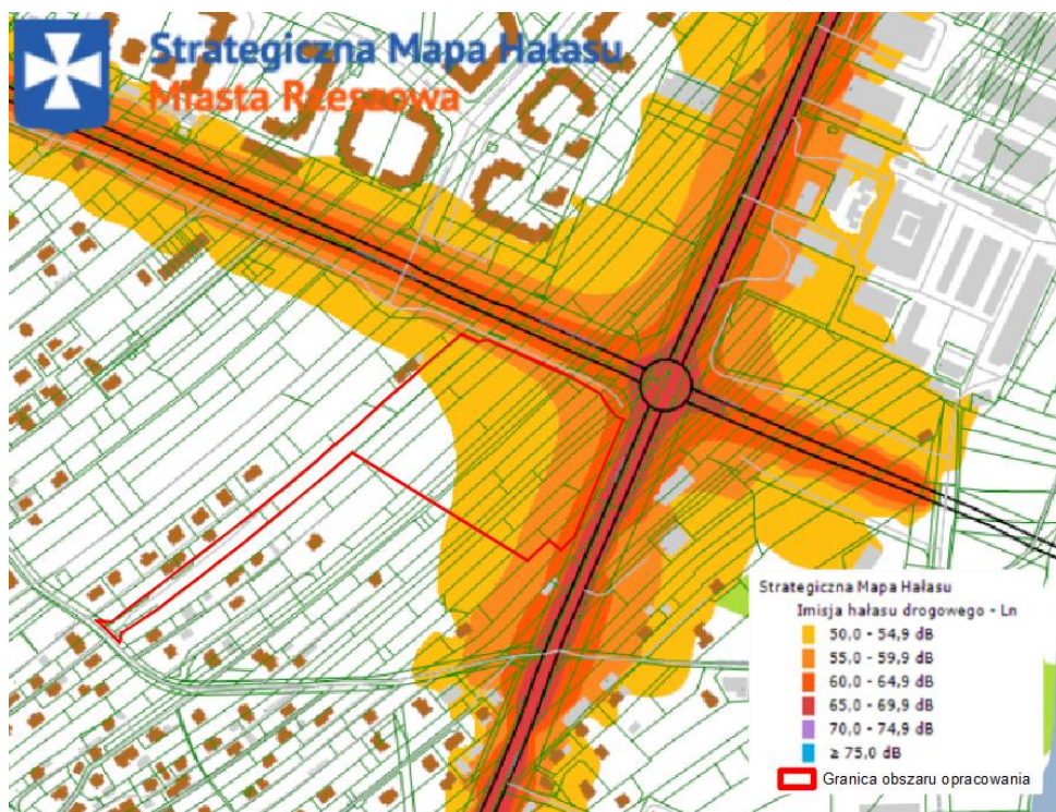
Strategiczna mapa hałasu drogowego Ln z nałożoną granicą terenu objętego opracowaniem mpzp